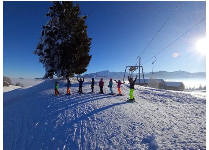
Noch über dem Nebel