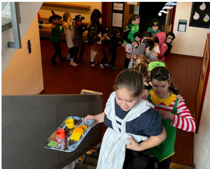
Keine Fasnacht ohne Polonaise