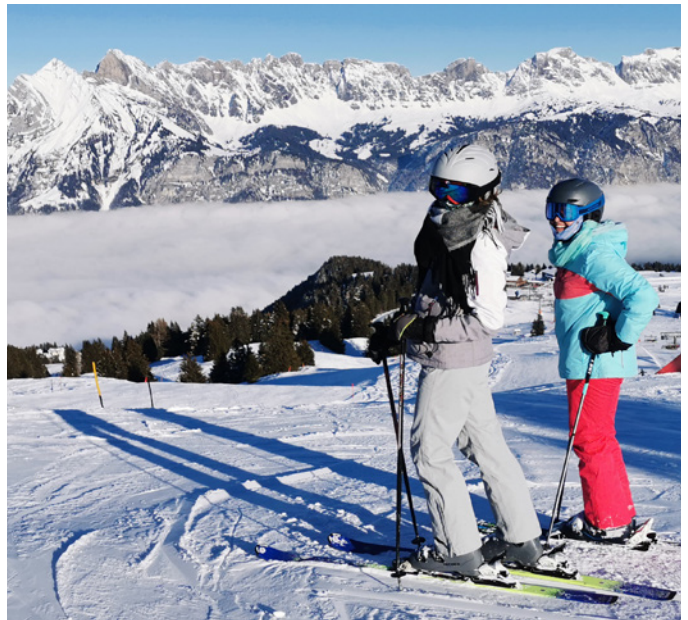
Beste Bedingungen über dem Nebelmeer