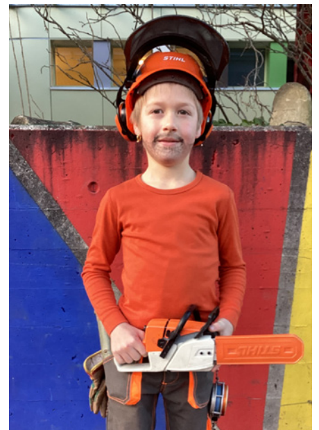
Ich bin bereit!