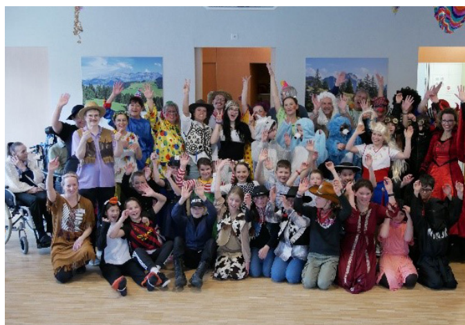
Freude bei Gross und Klein