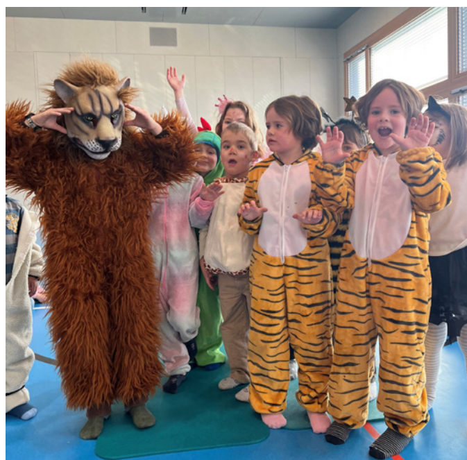
Die Tiere sind los