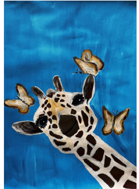
Ein freundliches Lachen versüsst den Tag