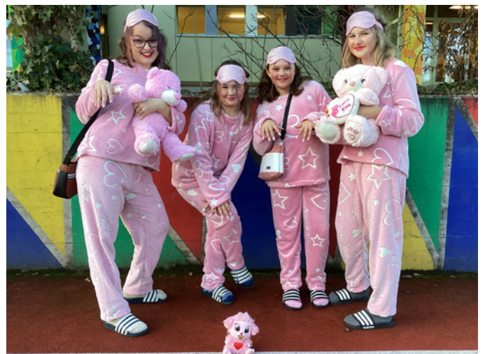
Oh, wie härzig!