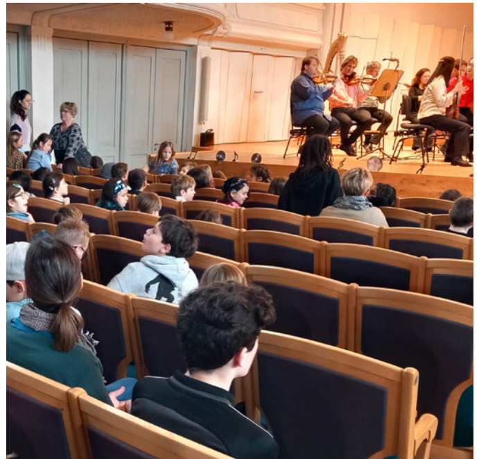
Let's dance – bald geht's los

Am 9. Februar 2024 gingen wir nach St. Gallen in die Tonhalle. Am Morgen gingen wir in die Schule und waren eine Lektion in der Schule. Dann liefen wir zum Bahnhof Brunnadern. Kurz nach neun gingen wir mit dem Zug nach St. Gallen. Als wir am Bahnhof St. Gallen angekommen waren, marschierten wir bis zur Tonhalle. Als wir bei der Tonhalle angekommen waren, haben wir noch Znüni gegessen. Dann gingen wir in die Tonhalle hinein und dort mussten wir die Jacken ausziehen. Als wir dann im oberen Stockwerk waren, konnten wir uns in die vorderen Reihen setzen. Es hatte viele verschiedene Instrumente wie Querflöten, Violinen, Bass, Trompeten, und eine Harfe. Damit spielten die Musiker verschiedene Tänze aus der ganzen Welt. Nach der Vorführung führen wir wieder mit dem Zug nach Brunnadern.