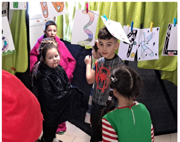
Geisterbahn – eine gruselige Angelegenheit