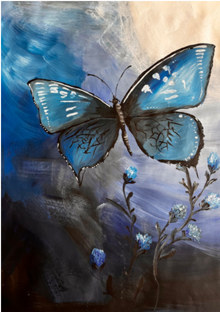
Sonne erhellt Schmetterling