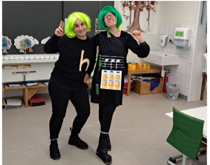
Fasnacht auch bei den Erwachsenen