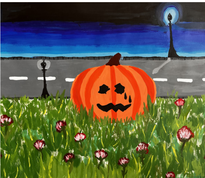
Der traurige Kürbis