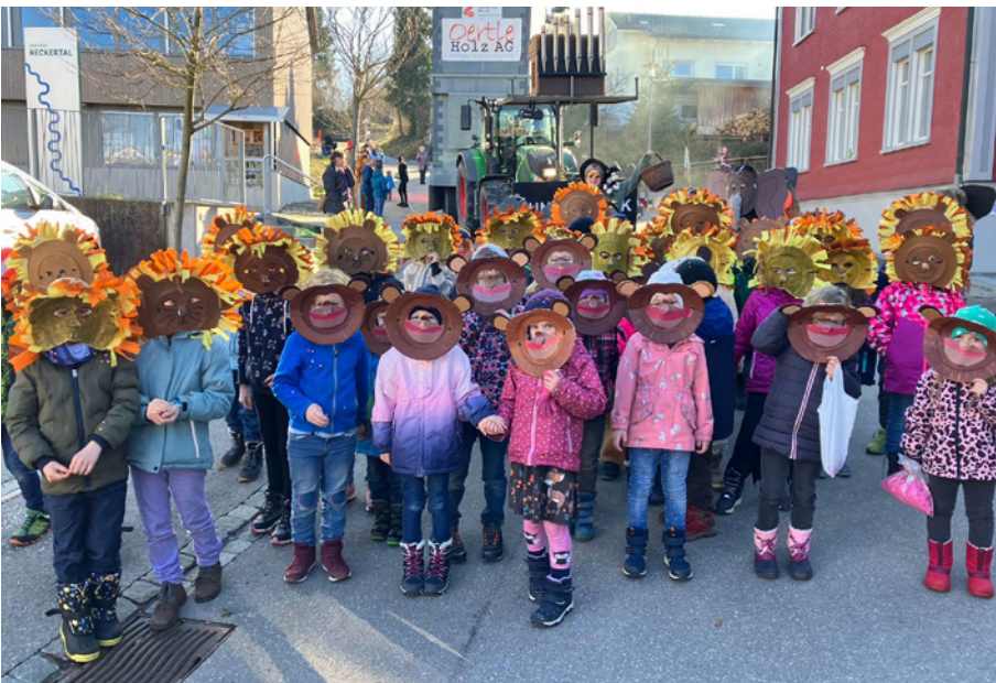
Der Zoo ist los!