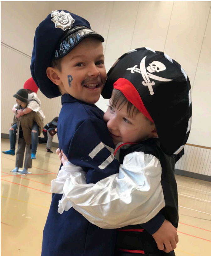
Verkleiden macht einfach Spass