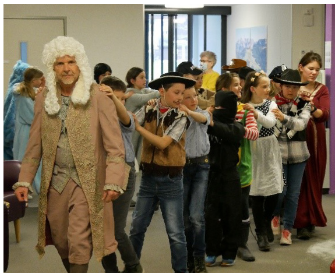
Polonaise durch alle Abteilungen