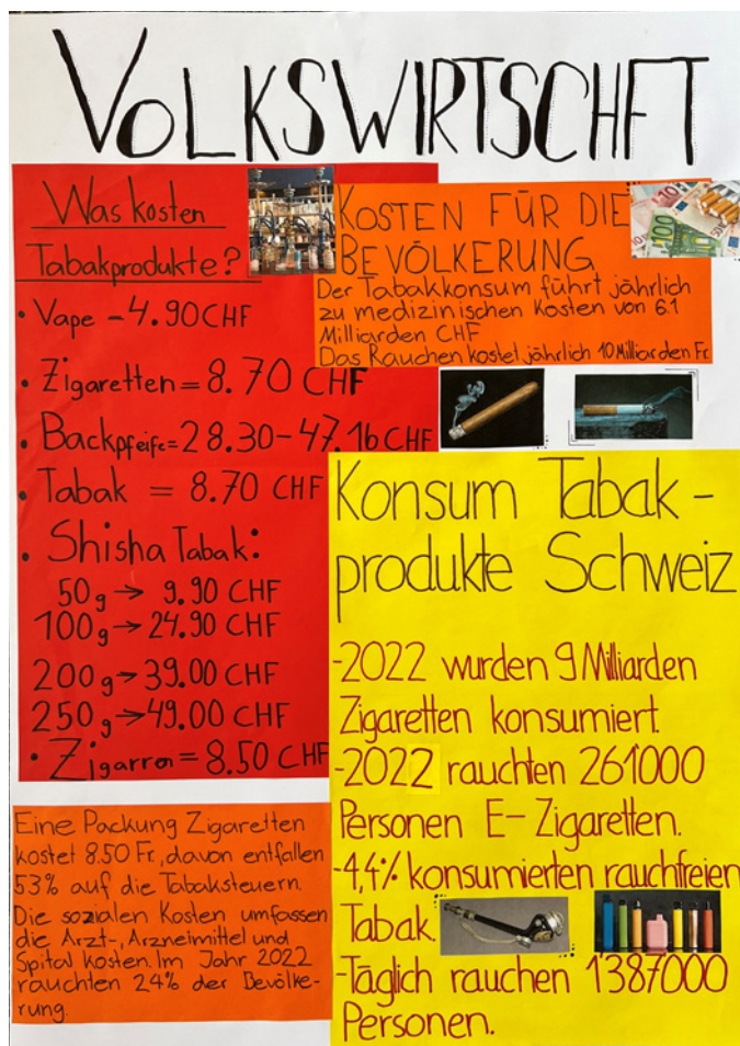
Workshopplakat aus der Klasse 2r