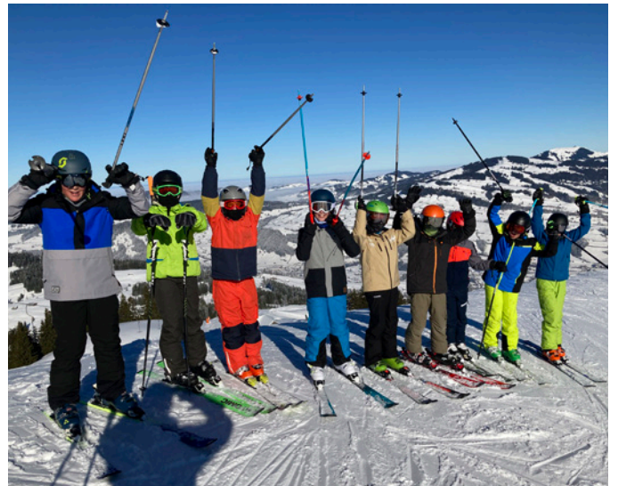
Vergnügt bei prächtigen Verhältnissen