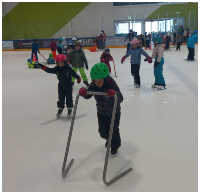
Zum Glück gibt es den Metallbügel