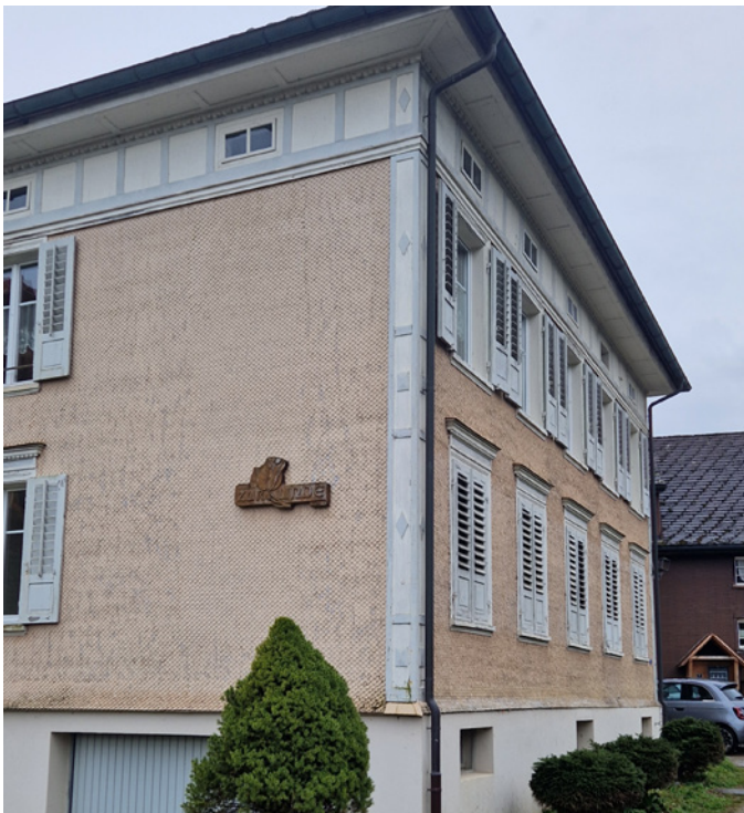
Neuer Standort "Linde"