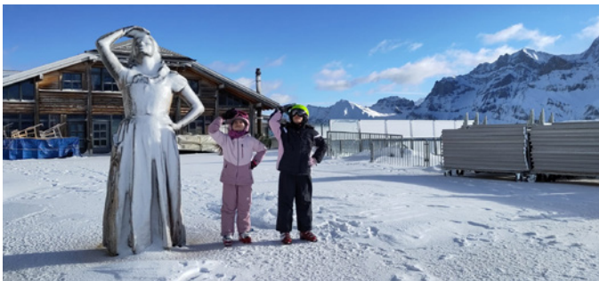
Vogellisi mit ihren Freundinnen