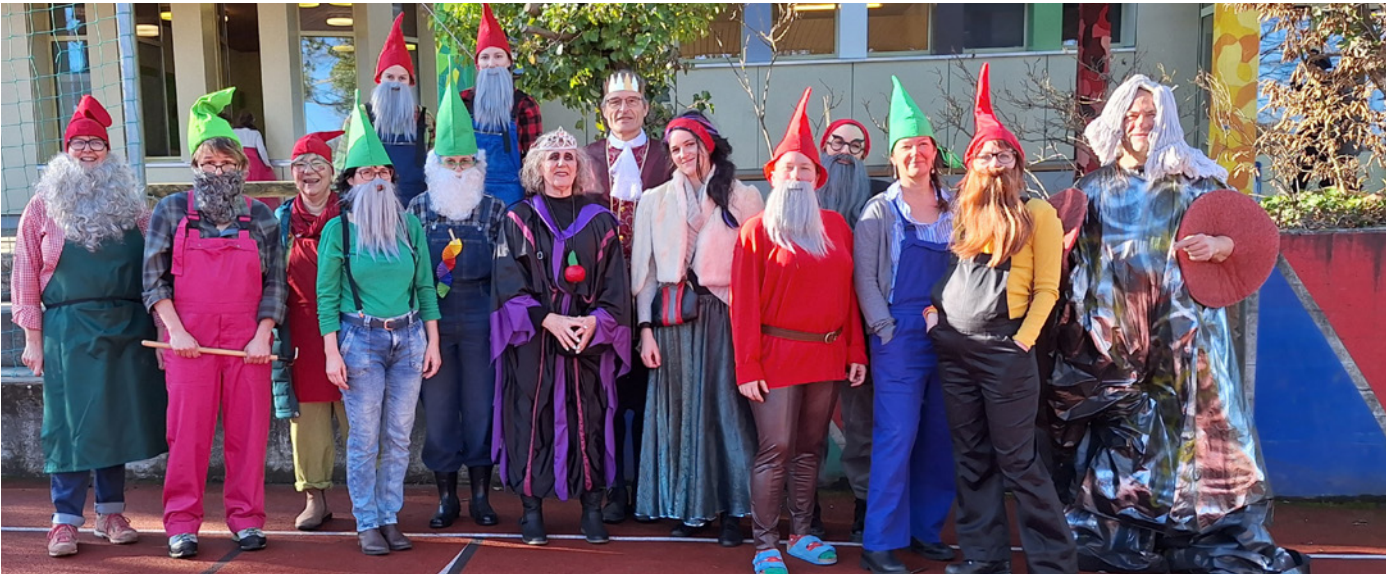
Schneewittchen und die 11 Zwerge